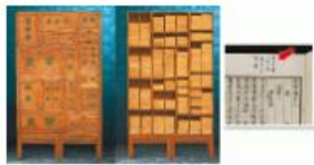
清光緒29年（1903年）同文書局石印本連書櫃《二十四史》

鑑定古籍有七字訣，就是紙、墨、字、行、序、批、裝，概括而言，欣賞所用紙張、印刷工藝、字體、版畫、內容、前人批校及裝幀。越古舊的書表示它越接近原裝內容，會有手民之誤的機會，所以蔣靄玲愛找曾被前朝名學者收藏、閱讀過甚至寫上校對心得的古籍，「他們睇過及寫上心得，完善內容的錯漏」。蔣靄玲就有明末毛晉創立的私人藏書樓汲古閣製作的《孫可之集》，書本早於17世紀初已面世，近代著名史學家黃永年曾收藏此書，並在書上寫上批校心得。